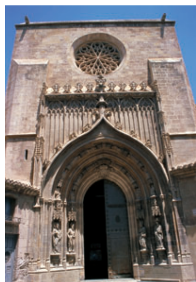
Puerta de los Apóstoles de la catedral de Murcia.

También destacan elementos escultóricos como la portada de los Apóstoles, y pictóricos como los retablos de la Virgen de la Leche, de Bartolomé de Módena y de San Miguel.